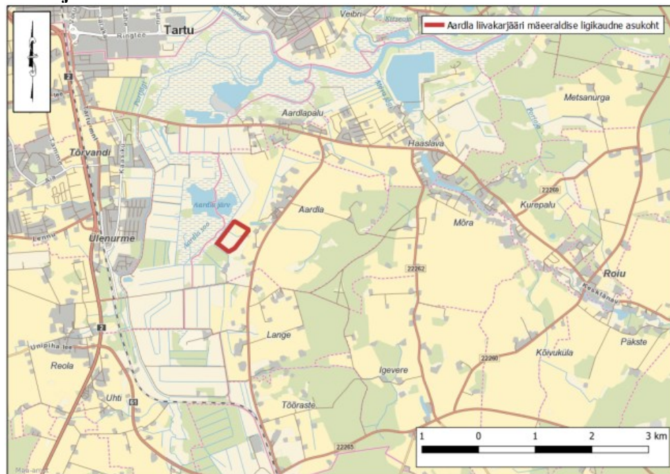
Aardla liivakarjääri asukohaplaan Aardla külas. KMH joonis 1. Aluskaart: Maa-amet

KMH aruande ja selle nõuetele vastavaks tunnistamise otsusega on võimalik tutvuda Keskkonnaameti keskkonnaotsuste infosüsteemi KOTKAS KMH registris või valides infosüsteemis KOTKAS ( https://kotkas.envir.ee ) menüüribalt „Registrid“ – „Keskkonnamõju hindamise register“ ning sisestada otsingusse märksõna: KMH01221 .